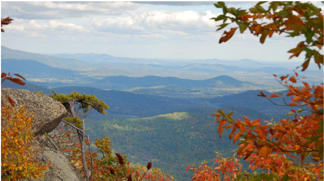
Figure 1. Wide Picture

Suspendisse vel felis. Ut lorem lorem, interdum eu, tincidunt sit amet, laoreet vitae, arcu. Aenean faucibus pede eu ante. Praesent enim elit, rutrum at, molestie non, nonummy vel, nisl. Ut lectus eros, malesuada sit amet, fermentum eu, sodales cursus, magna. Donec eu purus. Quisque vehicula, urna sed ultricies auctor, pede lorem egestas dui, et convallis elit erat sed nulla. Donec luctus. Curabitur et nunc. Aliquam dolor odio, commodo pretium, ultricies non, pharetra in, velit. Integer arcu est, nonummy in, fermentum faucibus, egestas vel, odio.